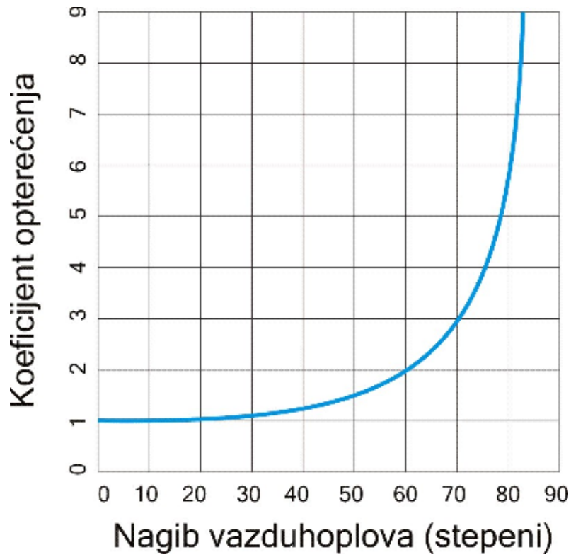
Slika PPL PoF-1.